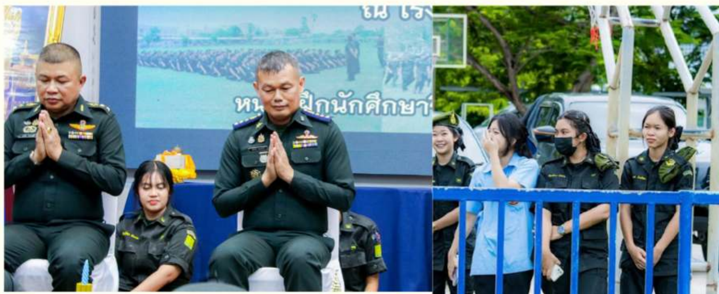
พิธีถวายสัตยาธิษฐานและเปิดการฝึกนักศึกษาวิชาทหาร ศูนย์ฝึกค่ายวชิรปราการ ณ โรงเรียนตากพิทยาคม วันที่ 16 สิงหาคม 2567