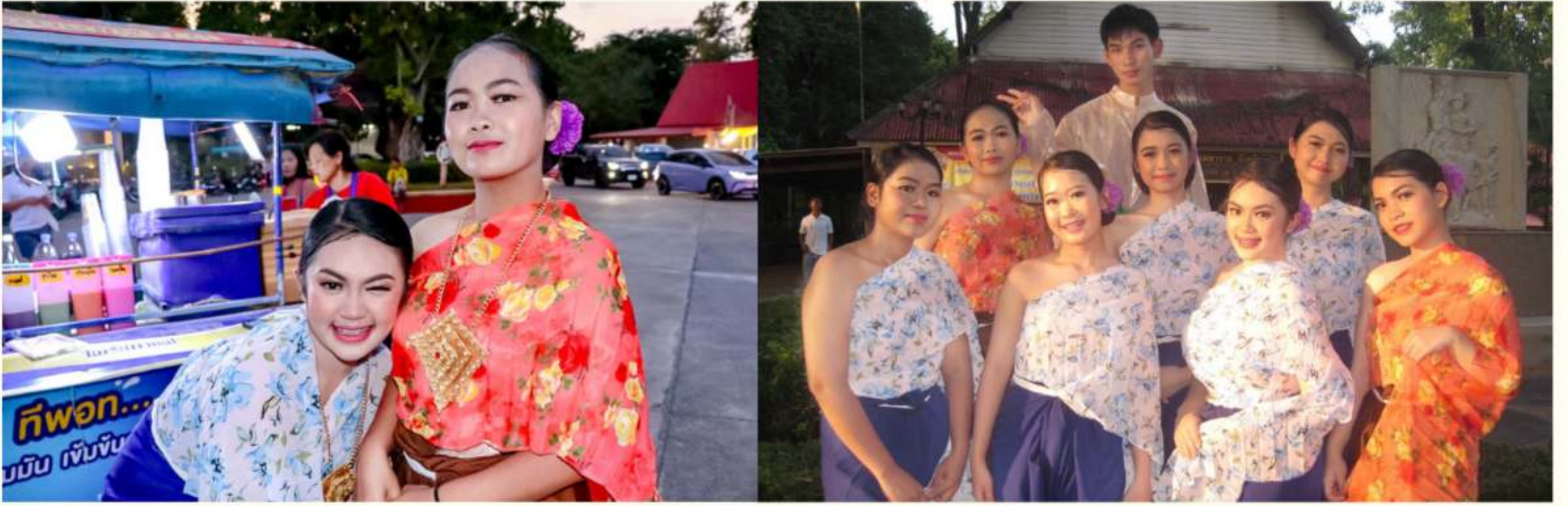
ร่วมเดินขบวนวันลอยกระทง ณ ศาลสมเด็จพระเจ้าตากสิน วันที่ 27 พฤศจิกายน 2567