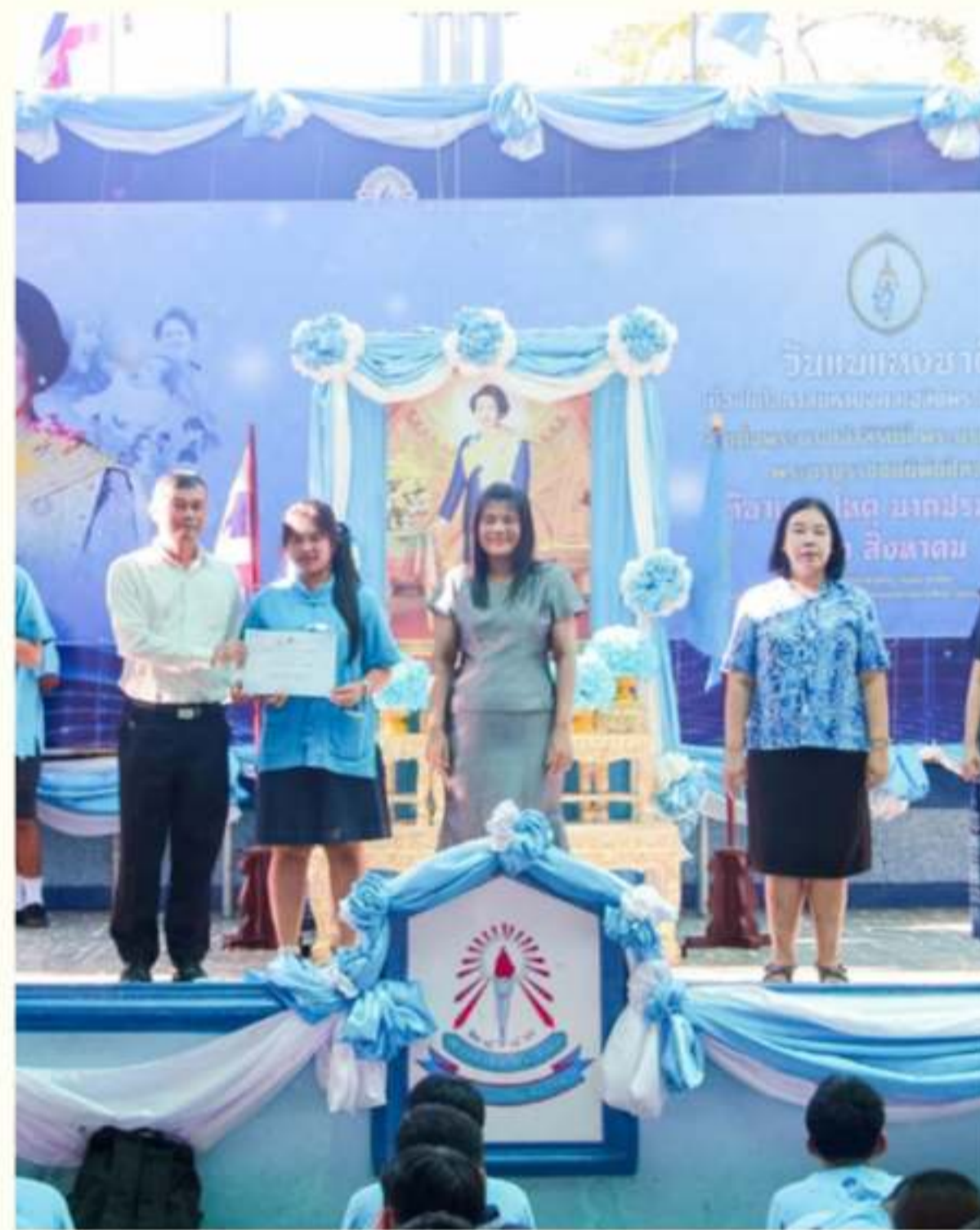
เนื่องในงานการแข่งขันสัปดาห์วิทยาศาสตร์ได้รับเกียรติบัตร ณ โรงเรียนตากพิทยาคม วันที่ 19 สิงหาคม 2567